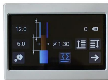
Pannello di controllo

Tramite il Pannello di controllo touch è possibile impostare tutti i parametri della lavorazione dei cavi, memorizzare le tipologie dei cavi e richiamare il programma memorizzato, fino a 100 programmi.