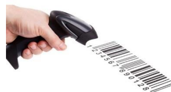
LETTORE DI BARCODE OPZIONALE

Mediante l'apposito lettore di BARCODE (opzionale) è possibile richiamare la lavorazione memorizzata in modo rapido e sicuro.